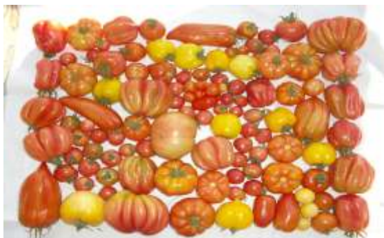
Tomatenvielfalt im Bärengarten.

Je nach Witterung starten wir mit unseren Kräuterführungen frühestens am 14.5.2025