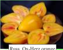
Russ. Ox-Herz orange