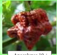
Apocalypse 10 +