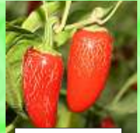
Jalapeno Gigante 5

Bärgarten-Kräuterdünger für Zuhause Alpakawolle zum Düngen und als Mulchschicht Gartenkalk aus ökologischem Gartenbau ab sofort erhältlich!