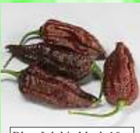
Bhut Jolokia black 10 +