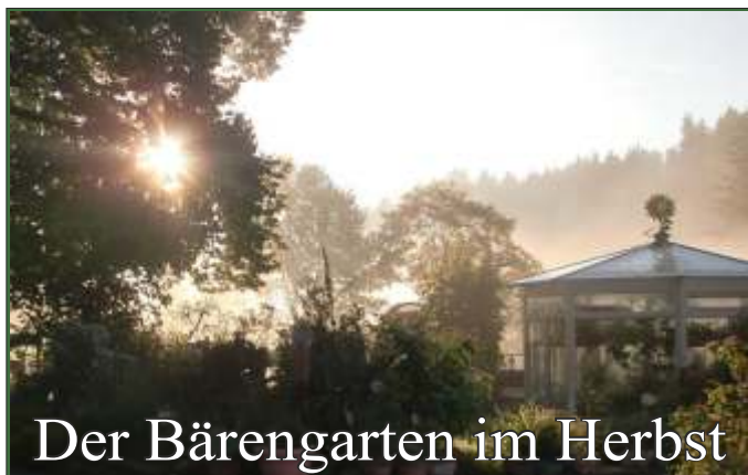
Der Bärengarten im Herbst

Die letzte Führung findet je nach Witterung am 15. Oktober statt!