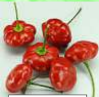
Brazil Starfish 7