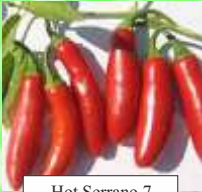
Hot Serrano 7